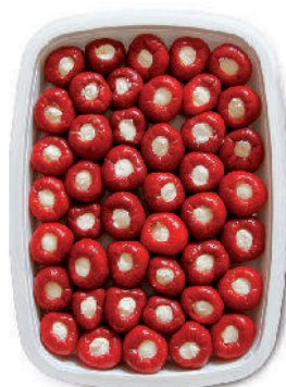
PEPERONCINI RIPIENI AL FORMAGGIO cod.048

Chili Peppers with tuna Gefüllte Peperoncini mit Thunfisch Petits piments farcis au thon