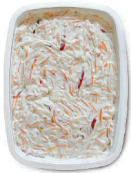
INSALATA CAPRICCIOSA cod.089

SOUCE AND PATÉ / SOSSEN UND PATÉ / SAUCES ET TAPENADE