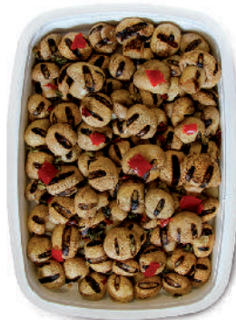
FUNGI CHAMPIGNON ARROSTITI cod.005

Grilled Artichokes / with Stem Artischocken Gegrillt / mit Stiel Grillées Artichauts / avec tige