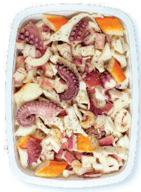
INSALATA DI MARE "ORIENTALE" cod.102

Seafood Salad Extra Meeresfrüchtesalat Extra Salade de Fruits de Mer Extra