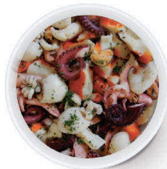
INSALATA DI MARE AL NATURALE cod.152

Seafood Salad Extra in brine Natur Meeresfrüchtesalat extra Salade de Fruits de Mer extra au naturel