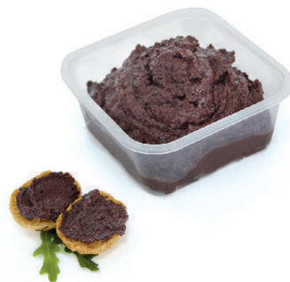
PATÉ DI OLIVE NERE cod.083

Green Olives paté Grüne Olivenpaste Tapenade de Olives verts