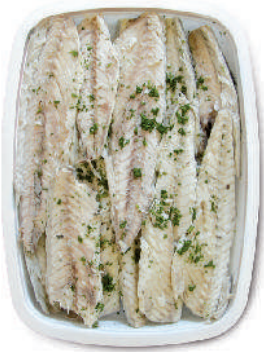
FILETTI DI SGOMBRO cod.107

SEAFOOD SPECIALTIES / MEER SPEZIALITÄTEN / SPÉCIALITÉS DE LE MER