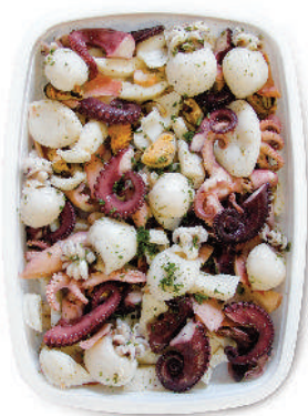
INSALATA DI MARE SUPERIOR cod.127

SEAFOOD SPECIALTIES / MEER SPEZIALITÄTEN / SPÉCIALITÉS DE LE MER