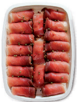
INVOLTINI DI SPECK AL FORMAGGIO cod.041

STUFFED ANTIPASTI / ANTIPASTI GEFÜLLT / LES ANTIPASTI FARCÌ