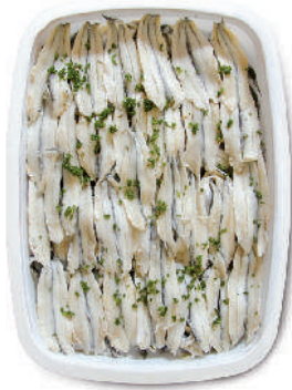
FILETTI DI ALICI MARINATE cod.108

Mackerel Fillets Makrelenfilets Filets de Maquereaux