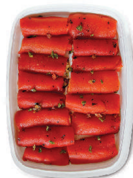
INVOLTINI DI PEPERONI cod.044 Ripieni con verdure

Aubergines Rolls with vegetables / cheese Auberginen Rollt mit Gemüse / Käse Roulades d'Aubergines avec légumes / fromage