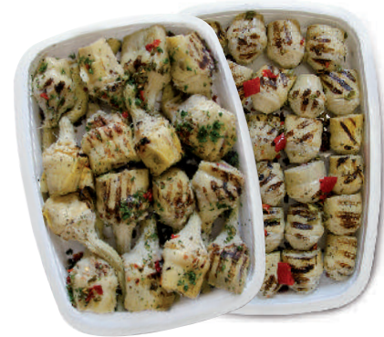
CARCIOFI ARROSTITI cod.003 Cuori cod. 004 con Gambo

Grilled Courgettes Zucchini Gegrillt Grillées Courgettes