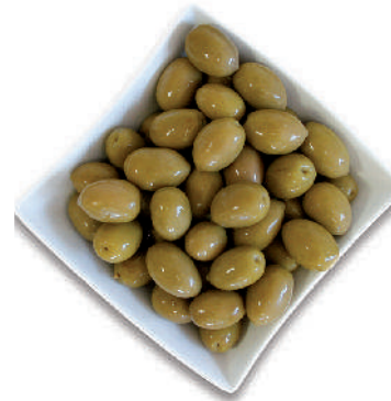
OLIVE VERDI GIGANTI IN SALAMOIA cod.068

Crushed Green Olives with Kernel / pitted Grüne Oliven zerkleinert / Entkernte Olives Vertes écrasées / dénoyautées