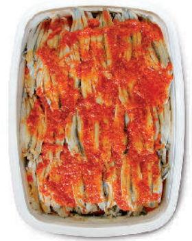
FILETTI DI ALICI PICCANTI cod.111

Anchovy fillets with garlic and parsley Sardellenfilets mit Knoblauch und Petersilie Filets d'Anchois avec ail et persil