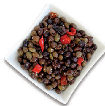
OLIVE NERE "LECCINO" cod.063 Con nocciolo cod.064 Denocciolate

Baked Black Olives Oliven schwarz Gebackene Olive Noires au four