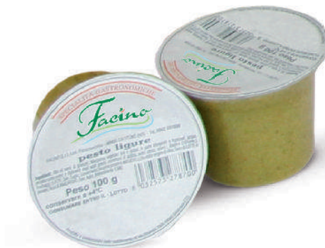
PESTO AL BASILICO cod.088

Basil Pesto Basilikumpesto Pesto au Basil