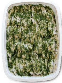
FILETTI DI ALICI CON AGLIO E PREZZEMOLO cod.109

Marinated Anchovy Fillets Marinierte Sardellenfilets Filets d'Anchois marinés