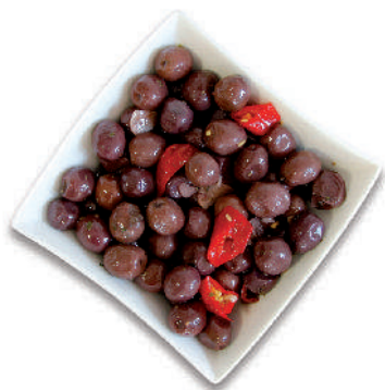
OLIVE NERE "ALLA MONACALE" cod.061

Black "Monacale" Olives Oliven schwarz "Monacale" Olive Noires "Monacale"