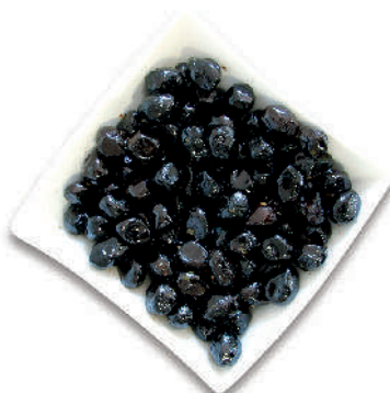
OLIVE NERE AL FORNO cod.062

Black "Monacale" Olives Oliven schwarz "Monacale" Olive Noires "Monacale"