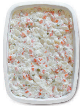
INSALATA RUSSA cod.090

Capricciosa Salad Capricciosa Salat Salade Capricciosa