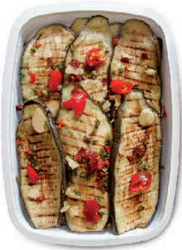
MELANZANE ARROSTITE cod.001

GRILLED VEGETABLES / GEMÜSE GEGRILLT / LÉGUMES GRILLÉES