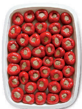
PEPERONCINI RIPIENI AL TONNO cod.047

Peppers Rolls with vegetables Peperoni Rollt mit Gemüse Roulades de Poivrons avec légumes