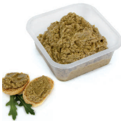
PATÉ DI OLIVE VERDI cod.082

Sun-Dried Tomatoes paté Getrockneten Tomatenpaste Tapenade de Tomates sèches