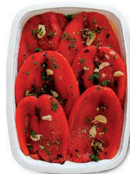
PEPERONI ARROSTITI cod.006

Grilled Champignon Mushrooms Champignon Pilze Gegrillt Grillées Champignon