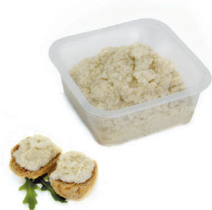
PATÉ DI CARCIOFI cod.084

Black Olives paté Schwarze Olivenpaste Tapenade de Olives noires