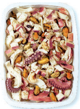
INSALATA DI MARE "EXTRA" cod.101

Seafood Salad Superior Meeresfrüchtesalat Superior Salade de Fruits de Mer Superior