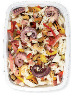
ANTIPASTO DI MARE "GOLOSO" cod.126

Seafood Salad Mix with surimi Meeresfrüchtesalat mit Surimi Salade de Fruits de Mer avec Surimi