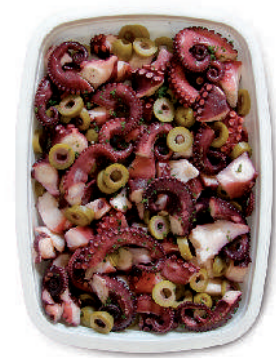
INSALATA DI POLPO CON OLIVE cod.105

Octopus Salad Krake-Salat Salade de Poulpe