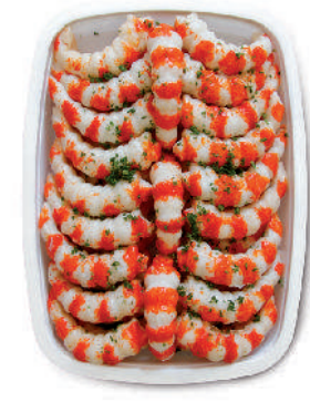
SURIMI AL SAPORE DI GAMBERO cod.119

Crab flavored Surimi Surimi Krebsfleischimitat Surimi aromatisé Crabe