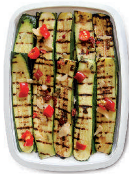
ZUCCHINE ARROSTITE cod.002

Grilled Aubergines Auberginen Gegrillt Grillées Aubergines