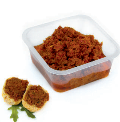
PATÉ DI POMODORI SECCHI cod.081

SOUCE AND PATÉ / SOSSEN UND PATÉ / SAUCES ET TAPENADE