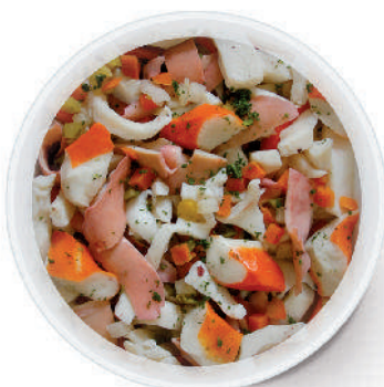
INSALATA DI MARE CON VERDURE AL NATURALE cod.153

Seafood Salad in brine Natur Meeresfrüchtesalat Salade de Fruits de Mer au naturel