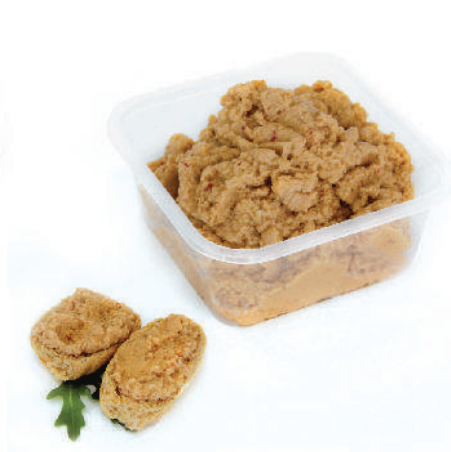
PATÉ DI MELANZANE cod.085

Artichokes paté Artischockenpaste Tapenade de Artichauts