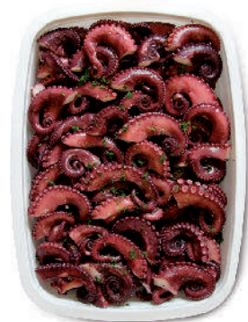
INSALATA DI POLPO cod.104

Seafood Salad with vegetables Meeresfrüchtesalat mit Gemüse Salade de Fruits de Mer avec légumes