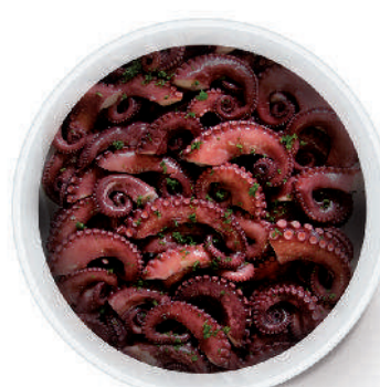
INSALATA DI POLPO AL NATURALE cod.154

Seafood Salad with vegetables in brine Natur Meeresfrüchtesalat mit Gemüse Salade de Fruits de Mer avec légumes au naturel