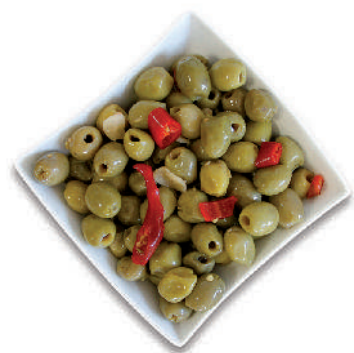
OLIVE VERDI DENOCCIOLATE cod.065

Black "Leccino" Olives with kernel / pitted Oliven schwarz "Leccino" / Entkernte Olive Noires "Leccino" / dénoyautées