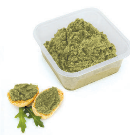
PATÉ DI ZUCCHINE cod.086

Aubergines paté Auberginenpaste Tapenade de Aubergine