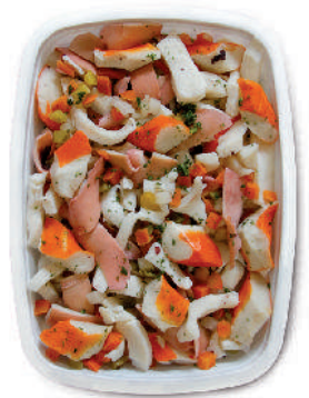
INSALATA DI MARE CON VERDURE cod.103

Seafood Salad with vegetables Meeresfrüchtesalat mit Gemüse Salade de Fruits de Mer avec légumes