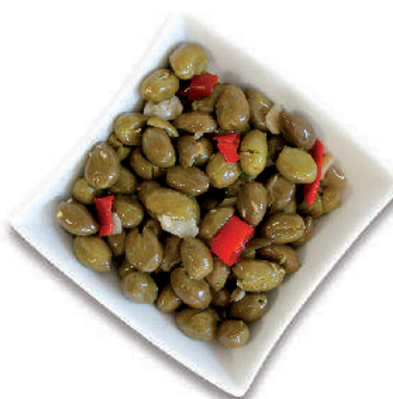
OLIVE VERDI SCHIACCIATE cod.066 Con nocciolo cod.067 "Della Nonna"

Green Olives pitted Entkernte Grüne Oliven Olives Vertes dénoyautées