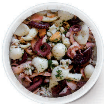
INSALATA DI MARE EXTRA AL NATURALE cod.151

NATURAL SEA SPECIALTIES / SPEZIALITÄTEN MEER NATÜRLICHE / SPÉCIALITÉS DE MER AU NATUREL