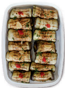
INVOLTINI DI MELANZANE cod.042 Ripieni con verdure cod. 043 Ripieni con formaggio al basilico

Speck Rolls with cheese Speck Rollt mit Käse Roulades de Speck au fromage