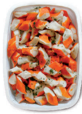
SURIMI AL SAPORE DI GRANCHIO cod.118

Mussels without shell Miesmuscheln geschält Moules Décortiquées