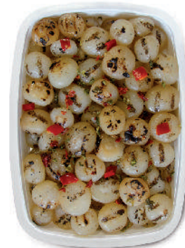
CIPOLLINE BORETTANE ARROSTITE cod.007

Grilled Pepper Peperoni Gegrillt Grillées Poivrons